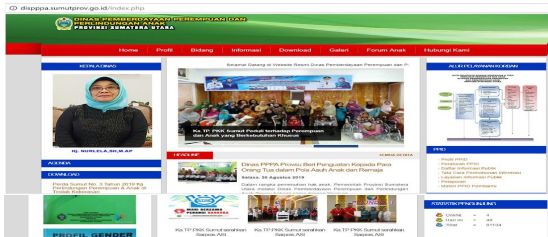
Gambar 1. Tampilan Muka/depan Website resmi Dinas Pemberdayaan Perempuan dan Perlindungan Anak Provsu ( dispppa.sumutprov.go.id )

Sistem Informasi Gender dan Anak (SIGA) sebagai sarana informasi baik kepada aparat pemerintah, swasta maupun kepada masyarakat luas yang membutuhkan layanan data/informasi gender dan anak serta informasi terkait pembangunan pemberdayaan perempuan dan perlindungan anak di Sumatera Utara. Dinas Pemberdayaan Perempuan dan Perlindungan Anak selaku PPID pembantu juga telah memanfaatkan layanan Sistem Informasi Publik – Pejabat Pengelola Informasi dan Dokumentasi (SIP-PPID) sebagai media informasi dan komunikasi kepada masyarakat, lembaga maupun instansi yang lain dalam penyampaian informasi publik yang dapat diakses secara gratis oleh masyarakat luas.