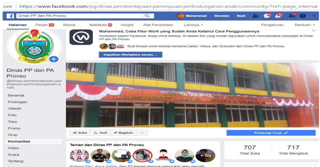
Gambar 3. Tampilan Beranda akun Media Sosial (Facebook) Dinas Pemberdayaan Perempuan dan Perlindungan Anak provsu