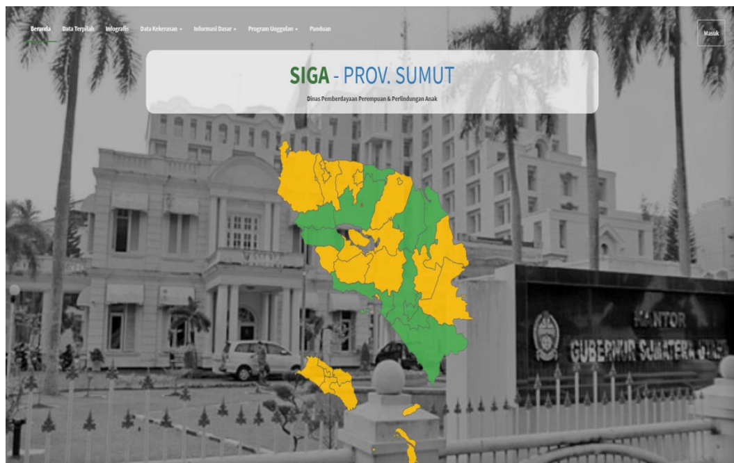
Gambar 2. Tampilan Muka/depan Sistem Informasi Gender dan Anak (SIGA/ siga.sumutprov.go.id )